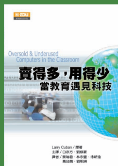
賣得多，用得少 當教育遇見科技 白亦方、劉修豪 主譯

..... 案例教學主要是以「案例」...(case) 做為講課的題材，案例教學法係指教學者利用案例教材的具體事實與經驗做為討論的依據與藍圖，經由師生的互動來探討案例的行為與緣由，促使學生應用所學，分析資料，解決實際問題，有助於專業人員的培育。在實際課程設計上，案例教學法提供了一個逼真、風險低、受督導的學習環境，讓準從業人員在執業之前，有機會學習如何將所獲得的知識應用到實務上，並且學會反省其執業活動的意義。