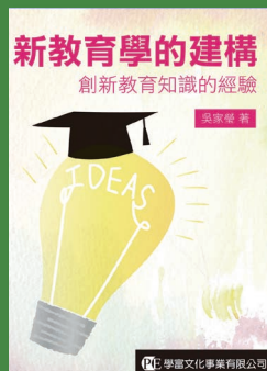
新教育學的建構 創新教育知識的經驗 吳家瑩 著