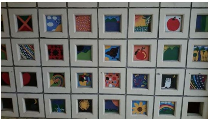
▶ 均一校園學生創作小角落之一